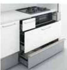
フロアスライド 小引出し