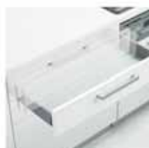
ショックアブソーバー 閉まる直前でショックを吸収し、 衝撃をやわらげます。