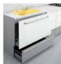
フロアスライド 包丁差し