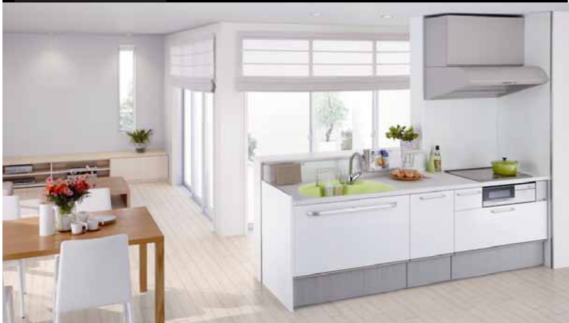
写真はイメージであり実際の仕様と異なります。