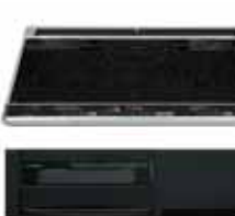
W600IHヒーター IH+ラジエント BCHA6D (パナソニック)