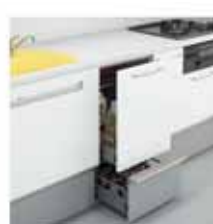
フロアスライド 可動棚