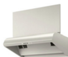
C(サイクロン)フード 標準タイプ CFA901SANM8

C(サイクロン)フードⅢ フロントキャッチ方式だから、 日常はシンプルなお手入れで大丈夫です。