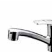
ハンドシャワー水栓 TKHG32PBE(Z)YL (TOTO)