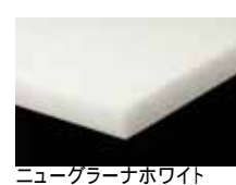
ニューグレーナホワイト